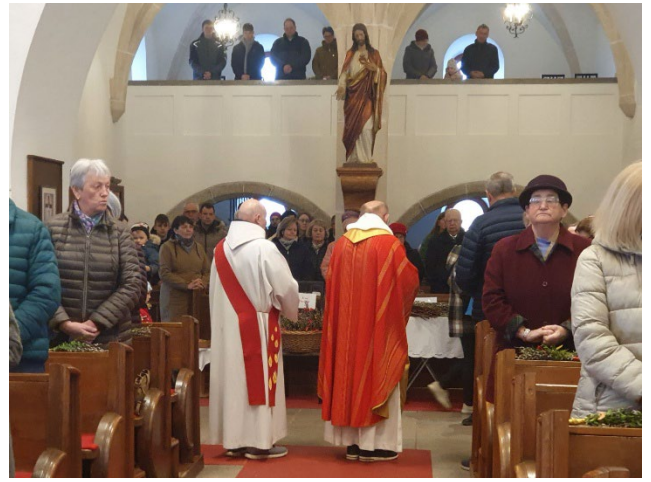
Feierlich gestalteten sich die Gottesdienste in der Karwoche und zu