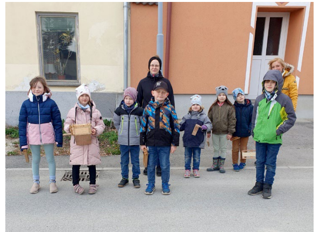
und die Ratscherkinder waren unterwegs.